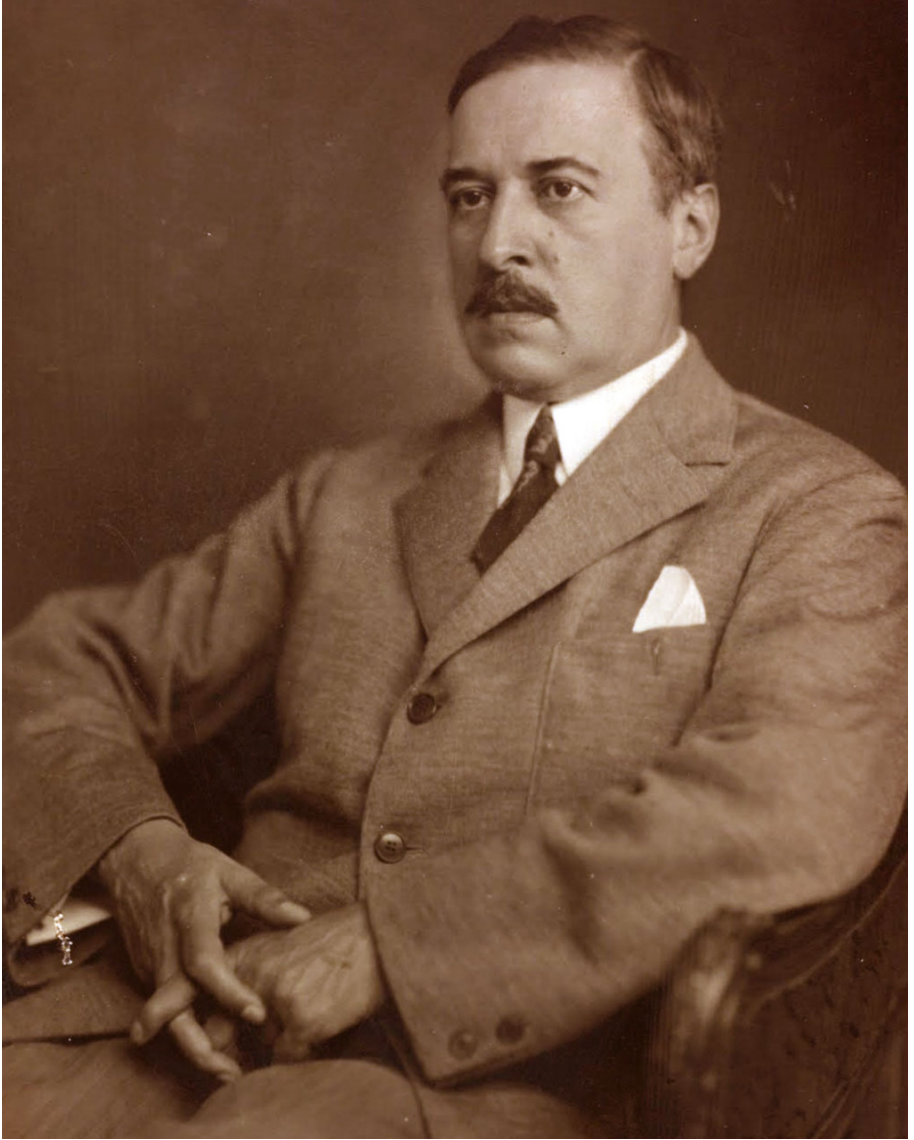
Hugo von Hofmannsthal